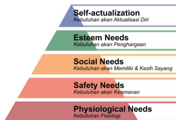
Gambar 1. Tingkatan kebutuhan menurut Maslow

Salah satu teori yang banyak digunakan sebagai referensi tentang kebutuhan adalah teori yang disampaikan oleh Abraham Maslow. Abraham Maslow menuangkan kebutuhan individu dalam piramida hierarki. Piramida tersebut terbagi menjadi lima tingkat. Tiap tingkat mendasari berikutnya yang lebih tinggi, dan demikian seterusnya (Widayat, 2021)