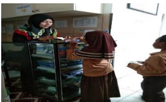
Gambar 2. Koperasi dan Kantin Madrasah

Kantin madrasah merupakan ruang/tempat yang menyediakan makanan dan minuman, Kantin ini berada dalam satu ruangan dengan koperasi sekolah. Kantin dikelola oleh madrasah dan bekerjasama dengan warga sekitar untuk menjualkan dagangannya. Kantin madrasah dibuka setiap hari selama masa aktif pembelajaran tatap muka. Manfaat dari adanya kantin madrasah adalah sebagai tempat penyedia makanan dan minuman bagi siswa sehingga tidak perlu membeli jajan di luar madrasah. Menurut (Syarifuddin & Khaedar, 2022) makanan di kantin haruslah bersih dan tidak mengandung zat-zat berbahaya bagi tubuh. Hal ini sejalan dengan (Musfiah et al., 2022) bahwa kantin akan menciptakan lingkungan yang sehat sebab makanan akan disortir terlebih dahulu sebelum dijual sehingga lebih terjamin kebersihannya.