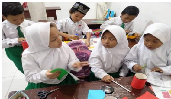
Gambar 3. Siswa Membuat Kerajinan Dari Botol dan Kaleng Bekas

Sampah yang dikelola berupa sampah anorganik seperti plastik, botol/kaleng minuman, kresek, ban bekas, besi, kaca, kabel, barang elektronik, bohlam lampu dan plastik. MI PERSMIN menyediakan tempat sampah organik dan anorganik. Pelaksanaan kegiatan tersebut sejalan dengan pendapat (Purnaningtyas & Fauziati, 2022) bahwa melalui pembiasaan untuk memilah sampah akan memberi pengalaman belajar dan membentuk karakter siswa yang cinta dan peduli lingkungan akan terbentuk.