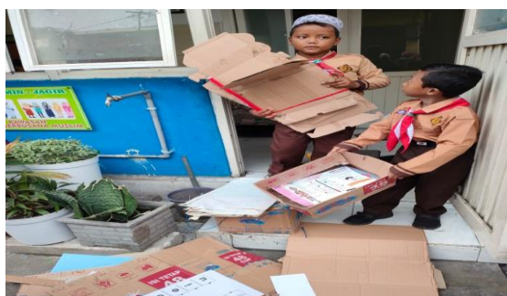
Gambar 4. Siswa Memilah dan Memilih Sampah Anorganik

Pengelolaan sampah dilakukan dengan prinsip 3R. ( Reuse, Reduce, Recycle ). Reuse dilakukan dengan menggunakan kembali wadah yang sudah kosong untuk fungsi lain dan memakai kertas yang masih kosong untuk menulis. Reduce atau pengurangan dilakukan dengan mengurangi penggunaan kemasan yang tidak bisa didaur ulang. Recycle atau Daur ulang dilakukan dengan mendaur ulang sampah plastik menjadi kerajinan tangan. Pengelolaan sampah dengan sistem 3R bisa dicoba oleh setiap orang kapan saja. Sebab menangani sampah dengan prinsip 3R hanya perlu meluangkan waktu dan kepedulian akan timbulnya penyakit. Hal ini sejalan dengan (Fauziah & Siahaan, 2022) bahwa pengelolaan sampah dengan 3R akan membuka wawasan dalam mengelola sampah menjadi sesuatu yang bernilai ekonomis.