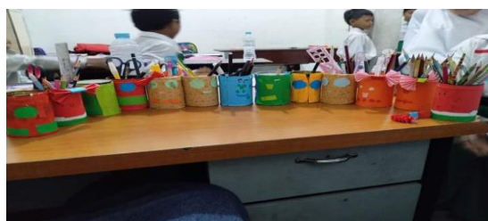
Gambar 5. Hasil Kerajinan Tangan Karya Siswa

Temuan penelitian menunjukkan bahwa bentuk-bentuk bimbingan dan arahan yang diberikan guru kepada siswa dapat menumbuhkan jiwa berwirausaha dan membentuk karakter siswa yang mandiri, kreatif, berani mengambil resiko, berorientasi pada tindakan, kepemimpinan dan kerja keras. Hal ini dibuktikan dengan siswa berhasil menyelesaikan tugasnya sendiri dalam memilah sampah. Siswa juga tidak malu meminta bantuan orang lain saat melakukan kegiatan kewirausahaan. Selain itu ide kreatif siswa juga diasah melalui pembuatan kerajinan berbahan sampah anorganik.