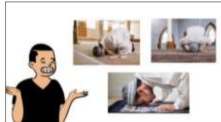
Gambar 3. Gambar orang sujud

Presentase yang diberikan oleh validator materi 1 yakni 87% menunjukkan sangat tinggi. Validasi materi 2 presentasinya sebesar 78% menunjukkan tinggi. Untuk validasi media video presentase yang didapatkan sebesar 90,2%. Sedangkan validasi media video ke 2 mendapatkan presentase sebesar 98% yang menunjukkan bahwa validasi media video 1 dan 2 sangat tinggi. Media video pembelajaran ini dapat meningkatkan motivasi belajar siswa dan mempermudah siswa untuk memahami materi tentang sujud syukur, sujud sahwi, dan sujud tilawah. Video pembelajaran ini juga dapat mempermudah siswa untuk mempelajari ulang dikarenakan video pembelajaran ini dapat diputar melalui smarthphone dan tidak perlu menggunakan internet jika sudah diunduh. Video pembelajaran ini dapat dijadikan guru sebagai media pembelajaran agar mempermudah guru untuk melakukan kegiatan belajar mengajar.