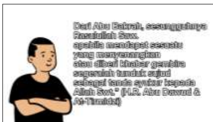
Gambar 6. Dalil sujud syukur