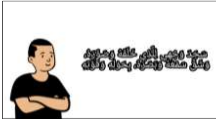
Gambar 2. Perbaikan ayat sajdah

tidak memberikan saran dan revisi. Untuk validator materi memberi saran untuk menambahkan gambar orang yang sedang bersujud dan menuliskan bacaat sujud tilawah menggunakan huruf Bahasa Arab.