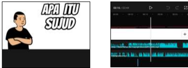
Gambar 1. Foto proses pembuatan video ajar aplikasi capcut

Untuk validasi video terdapat 18 aspek dari 2 indikator. Validasi materi terdapat 16 aspek dari 3 indikator.