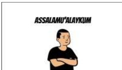
Gambar 2. Pembukaan Video Ajar

Spesifikasi produk media pembelajaran berupa video pembelajaran menggunakan aplikasi CapCut pada mata pelajaran pendidikan agama Islam :