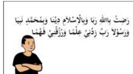
Gambar 3. Membaca do'a belajar