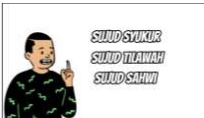
Gambar 4. Menyebutkan materi