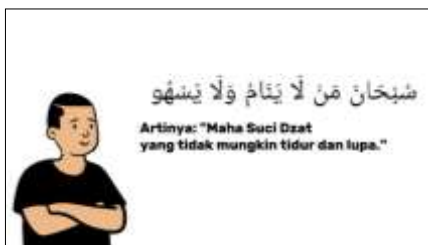
Gambar 8. Bacaan sujud sahwu