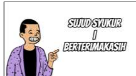
Gambar 5. Menjelaskan sujud syukur