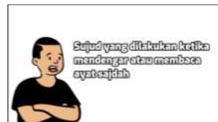
Gambar 9. Menjelaskan sujud tilawah

Tahap perbaikan dilaksanakan sesudah uji validitas serta memperoleh validasi dari validator materi dan media. Perbaikan dilaksanakan ketika memperoleh saran yang terdapat di lembar uji instrumen validasi dari validator. Saran ini akan dijadikan pedoman untuk melakukan perbaikan media video pembelajaran. Untuk validator media